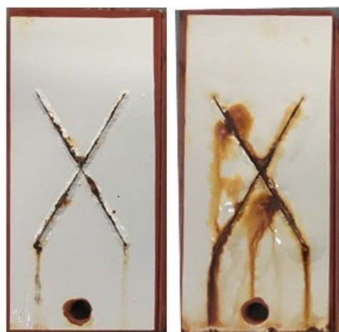
(a) 反応性塗料試験片 (b) Rc-III 試験片

3-1 反応性塗料試験片と比較塗料(Rc-III 仕様)試験片の乾湿繰り返し試験 3,240 時間終了後の外観を図 2 に、平均膨れ幅の経時変化を図 3 に示す。どの試験時間においても反応